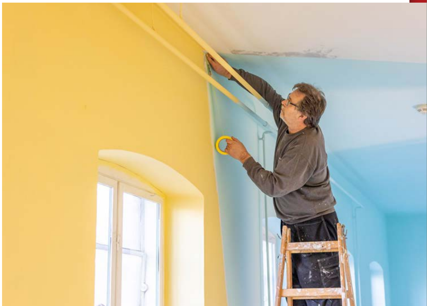
Teknisk Afdeling brugte en stor del af vinteren på at klargøre og male rummene til den nye udstilling "ANBRAGT".