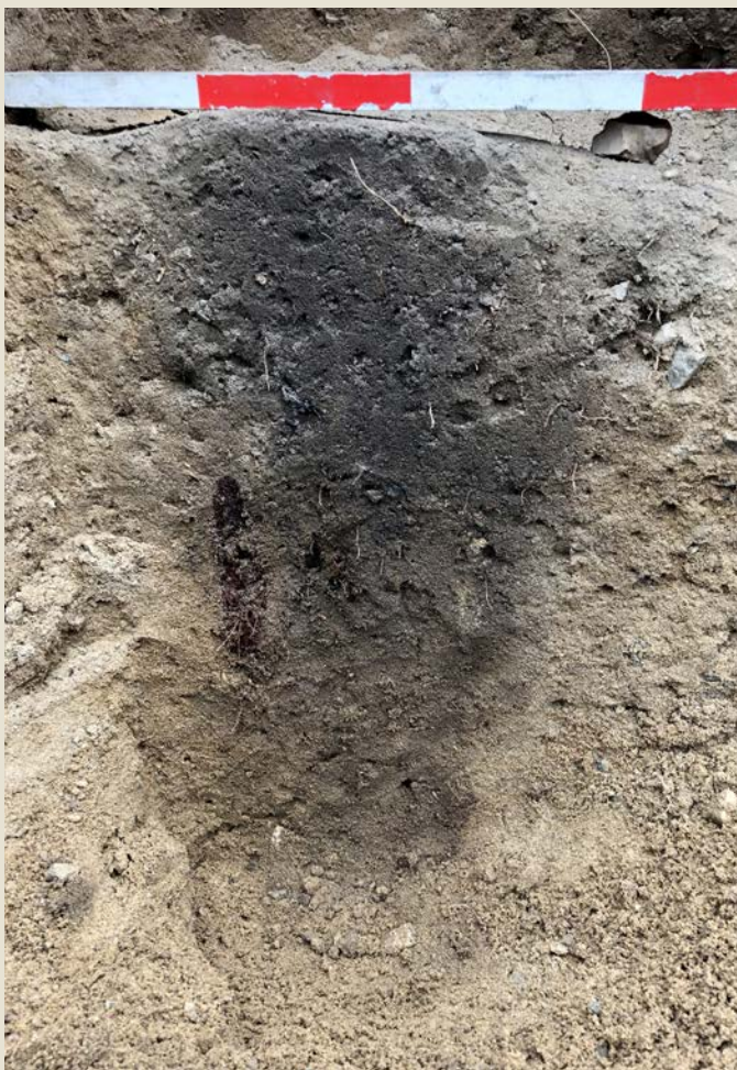
Snit gennem det 10.000 år gamle stolpehul.

Den sidste uge af gravelejren bød også på nogle unikke fund. På det tidspunkt blev der gravet intenst i især den nordøstlige del af feltet, hvor der begyndte at dukke nogle små gruber op, indeholdende brændte hasselnøddeskaller. Hasselnødder var en vigtig del af maglemosefolkets daglige kost, og her stod vi altså med nogle 10.000 år gamle måltidsrester fra hasselnødder, der var blevet ristet på et ildsted. Det helt store og endnu mere uventede fund kom dog, da et af de formodede ildsteder fortsatte i dybden og viste sig at være et forkullet stolpehul. Det er tilnærmelsesvist usandsynligt, at man i sin karriere som arkæolog en dag kan stå og se på et stolpehul, som måske er 10.000 år gammelt. Det er virkelig unikt.