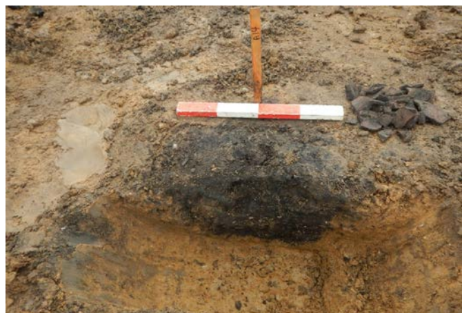
En af brandgravene, der er snittet ned igennem midten.

Den anden egentlige undersøgelse opstod i forbindelse med en forundersøgelse af blandt andet kabeltracéer til en solcellepark øst for Tved. Her blev i det nordvestlige hjørne påtruffet nogle brandgrave fra førromersk jernalder (ca. 500 f.Kr. – 0). Ved den egentlige undersøgelse fremkom der i alt 9 brandgrave, der indeholdt rester af ligbålene, inklusiv de brændte knogler af de afdøde, der var lagt ned i en lille fordybning i undergrunden. Denne gravtype er helt typisk og enerådende for førromersk jernalder, ligesom den i øvrigt også er det for yngre bronzealder, der er perioden lige før, hvor man dog ofte kom asken og de brændte knogler i en urne, som så kom i jorden. Lige nord for brandgravene blev der også fundet nogle anlæg, der foreløbig tolkes som hørbrydningsgruber. Disse er det dog ikke muligt at datere nærmere uden en 14 C-datering.