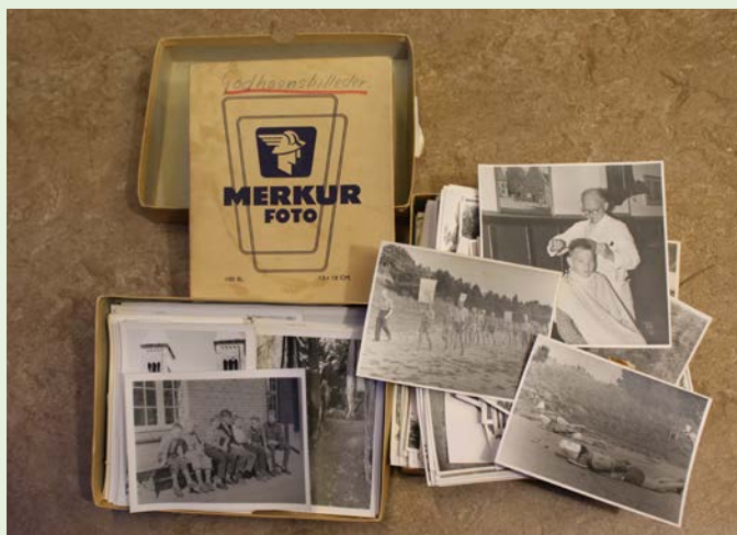
Et udsnit af fotosamlingen fra Godhavn og Spanager