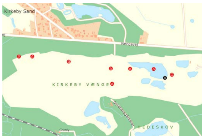
Oversigt over undersøgelser i grusgraven, markeret med røde cirkler. Nogle cirkler indeholder flere udgravninger.

Den anden egentlige undersøgelse opstod i forbindelse med en forundersøgelse af blandt andet kabeltracéer til en solcellepark øst for Tved. Her blev i det nordvestlige hjørne påtruffet nogle brandgrave fra førromersk jernalder (ca. 500 f.Kr. – 0). Ved den egentlige undersøgelse fremkom der i alt 9 brandgrave, der indeholdt rester af ligbålene, inklusiv de brændte knogler af de afdøde, der var lagt ned i en lille fordybning i undergrunden. Denne gravtype er helt typisk og enerådende for førromersk jernalder, ligesom den i øvrigt også er det for yngre bronzealder, der er perioden lige før, hvor man dog ofte kom asken og de brændte knogler i en urne, som så kom i jorden. Lige nord for brandgravene blev der også fundet nogle anlæg, der foreløbig tolkes som hørbrydningsgruber. Disse er det dog ikke muligt at datere nærmere uden en 14 C-datering.