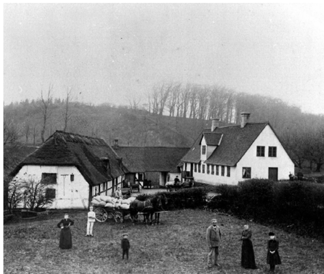
Øverste Ørkilds mølle fotograferet i begyndelsen af 1900-tallet. Bygningen til venstre er nedrevet, de andre bygninger består endnu. Måske er det en stakket frist.

I efteråret havde vi som vanligt samlingsrevision, og som det efterhånden er blevet en rigtig god vane, lykkedes det hurtigt at opfylde alle revisorens ønsker. Det er en særlig tilfredsstillende for dem på museet, som kan huske, at det ikke var sådan. Vi fik også finjusteret vores klimaanlæg, så vi kom ud af 2021 med et strømförbrug, der blot var halvt så stort som året før. Det batter noget i en tid med voldsomt stigende elpriser.