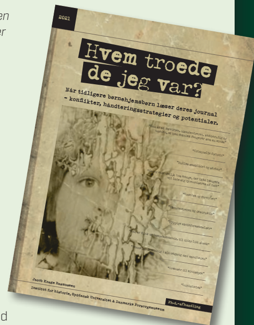
Omslaget til afhandlingen "Hvem troede de, jeg var?"

Afhandlingen er dermed et vigtigt skridt i museets ambition om at kunne hjælpe og støtte tidligere anbragte i deres erindringsarbejde og i udbygningen af vores historiske viden om anbringelsernes individperspektiv.