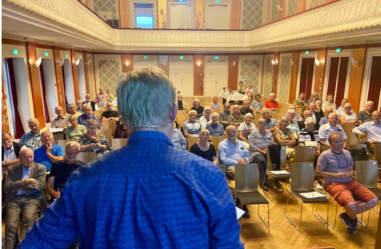
Museumschefen fortæller om museets planer ved årsmødet d. 23. august i den smukke Guldsgl.

for Lystsejls har indgået en samarbejdsaftale omkring brug af hallen på Frederiksøen. Et synligt bevis på det i 2021 var 3 temaudstillinger hen over sommeren.