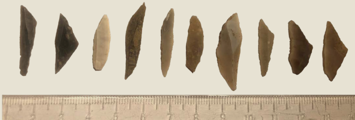
Et udvalg af mikrolitter fundet i løbet af de 3 uger.

Det var tre meget varme uger i juli måned, at lejren stod på. Men deltagerne gravede sig lystigt ned igennem gruset, og hver gang der dukkede en mikrolit eller et andet fint fund frem, gav det ekstra blod på tanden. Flere tusinde stykker af flint blev gravet frem, registreret og lagt i pose i løbet af gravelejren.