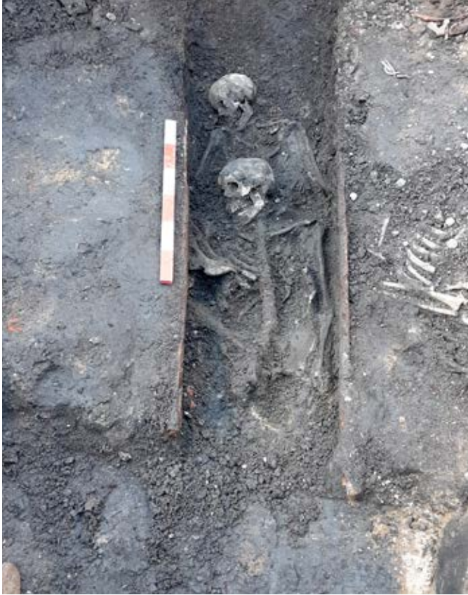
Dobbeltgrav med tydelige kistesider.