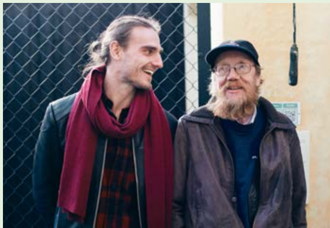
De anbragtes vilkår og Danmarks Forsorgsmuseum i makkerskab til arrangementet "Anbragt i fortiden, nutiden og fremtiden".