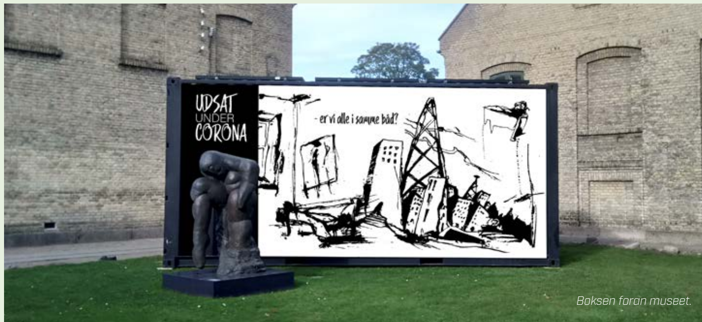
Boksen foran museet.

I vinter- og efterårsferien havde museet +ca. 50 % flere besøgende, og i sommerferien +72 % ift. 2019. Det totale besøgstal så en nedgang på -18 % i forhold til 2019 (museet holdt lukket grundet nedlukningen i 26 % af året).