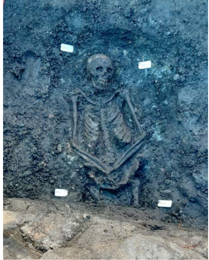
Velbevaret enkeltgrav uden spor af kiste.

Samlet set har den seneste udgravning på Klosterplads bidraget til et større overblik over klosterkomplekset og lægmandskirkegården, som har været en central del af det middelalderlige Svendborg gennem århundreder, fra klosterets grundlæggelse i 1236 til kirkens nedrivning i 1828. Som en sidegevinst blev der inden for et afgrænset areal med området kirkegårdsjord gjort talrige fund af flinteafslag, skrabere og flækkeblokke, hvilket vidner om, at landskabet her har leveret gunstige levevilkår for mennesker tusinder af år, før munkene tog det i besiddelse.