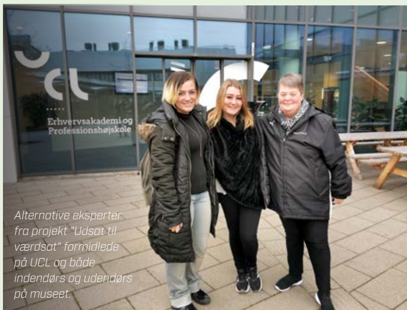
Alternative eksperter fra projekt "Udsat til værdsat" formidlede på UCL og både indendørs og udendørs på museet.

Museet havde i 2020 seks alternative eksperter ansat. To af disse er ansat i fleksjob, to i studiejob og to på det sociale frikort. Herudover er 25-30 alternative eksperter kontinuerligt tilknyttet i forskellige projekter.