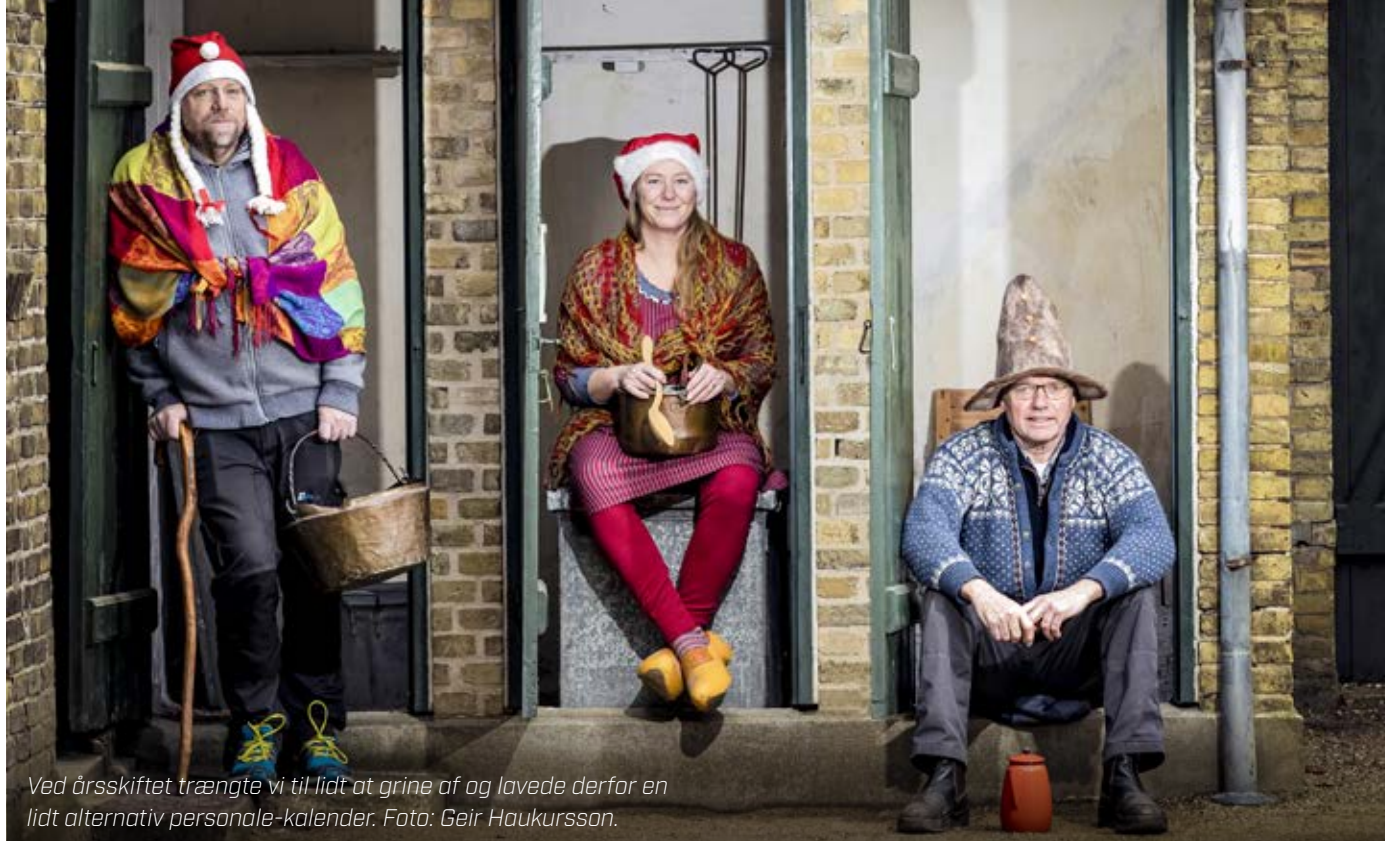
Ved årsskiftet trængte vi til lidt at grine af og lavede derfor en lidt alternativ personale-kalender.