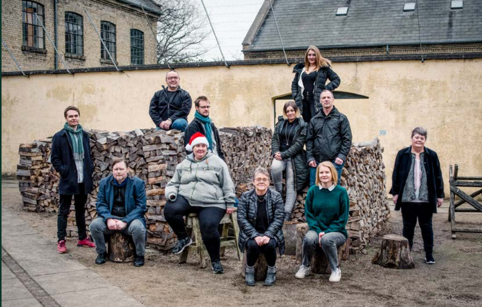
Fællesbillede af projektdeltagerne i "Fra udsat til værdsat".

Det blev desuden til to konkrete formidlingsprojekter med afsæt i corona-krisens vilkår for borgere i udsatte eller sårbare positioner. I samarbejde med Instafilm gennemførte museet for det første et kortfilmsforløb med og til gavn for sårbare og udsatte unge på Fyn i slutningen af 2020. Her fik 60 deltagere undervisning af professionelle i filmproduktion, og de lærte, hvordan man instruerer film. Deltagerne skabte 18 stærke og delvist selvbiografiske kortfilm med deres egne budskaber. Kortfilmene vises i løbet af 2021 på museets digitale platforme.