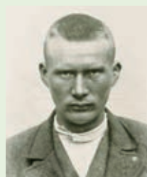
Nutidige portrætter af Jón Bjarni Hjartarson.