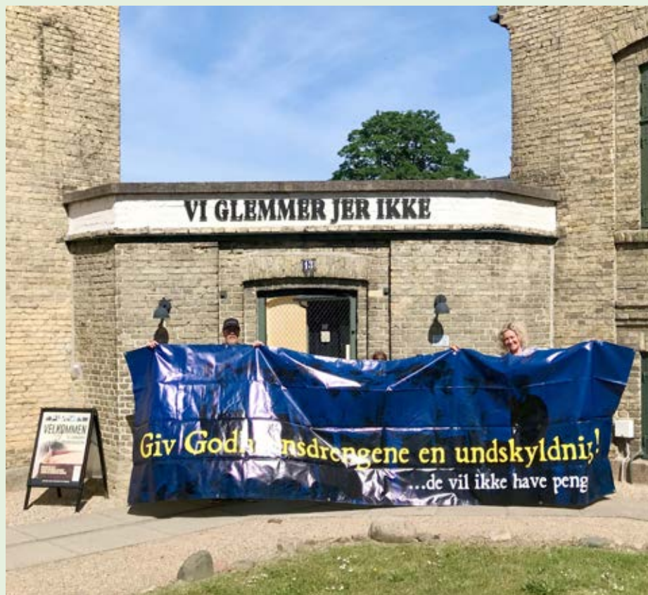
Landsforeningen Godhavnsdrene donerede i juni deres banner, som har fulgt dem i kampen for en undskyldning i omkring 10 år.